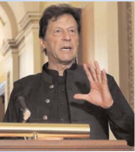
वाशिंगटन। वित्तीय कार्रवाई कार्य